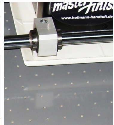
ST 120 Vakuumschertisch ST 120 vacuum shearing table