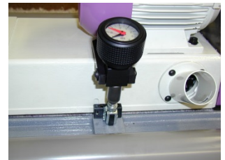
Teppich-Polaufbereitungsmaschine PA 320 Carpet pile preparing machine PA 320