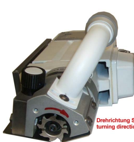
SE 50 L