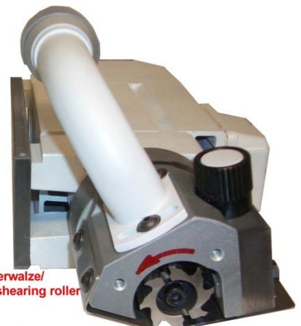
SE 50 R

Drehrichtung Scherwalze/ turning direction shearing roller